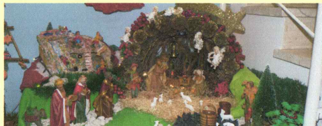
Presepi di medie dimensioni realizzato dai Ragazzi dell'Associazione Casa Mia Onlus Dopo di Noi A.P.S.