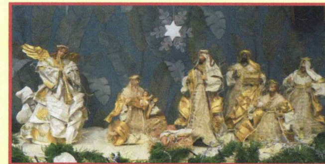
Presepe di medie dimensioni realizzato da: Longobardi Carmela.