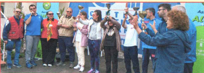
A Marini la 37° edizione del Trofeo Alema 11-05-2025