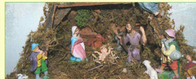
Presepi di piccole dimensioni realizzato da: D'Amico Michelina