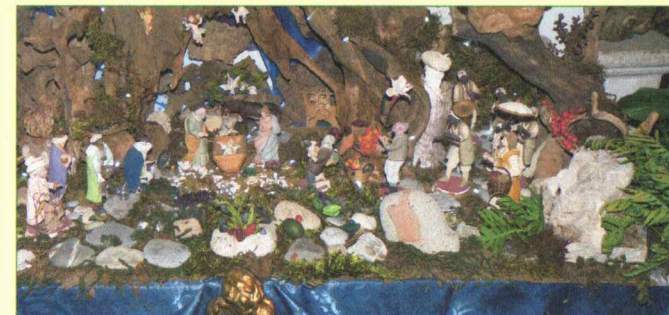
Presepi di medie dimensioni realizzato da: D'Onofrio Lucia.