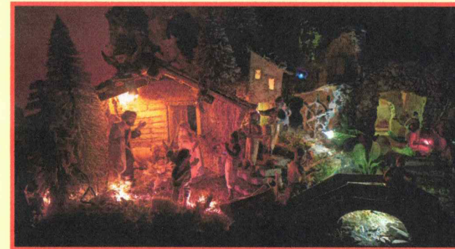
Presepe di Piccole dimensioni realizzato da: Alfano Anna.