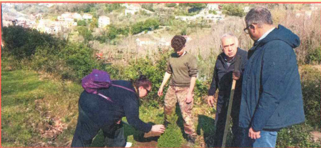
Piantumazione alberi di natale da Enel Energia a valle 22-02-2025