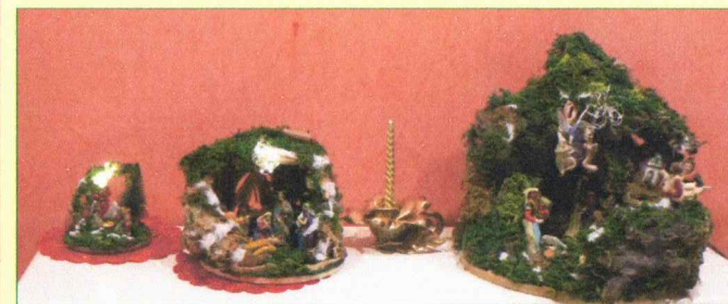
Tris di Presepi di piccole dimensioni realizzato da: Gaeta Carmela.

→ all'edizione Presepe in Famiglia 2024-2025.