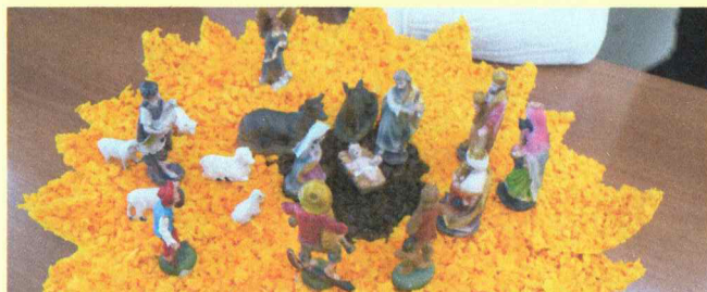
Presepi di piccole dimensioni realizzato dai Ragazzi di Villa rende Il Girasole di Salerno.

→ all'edizione Presepe in Famiglia 2024-2025.