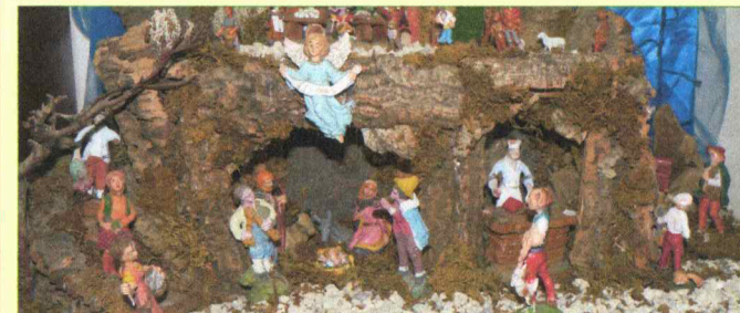
Presepi di piccole dimensioni realizzato da: Napoli Lidia.